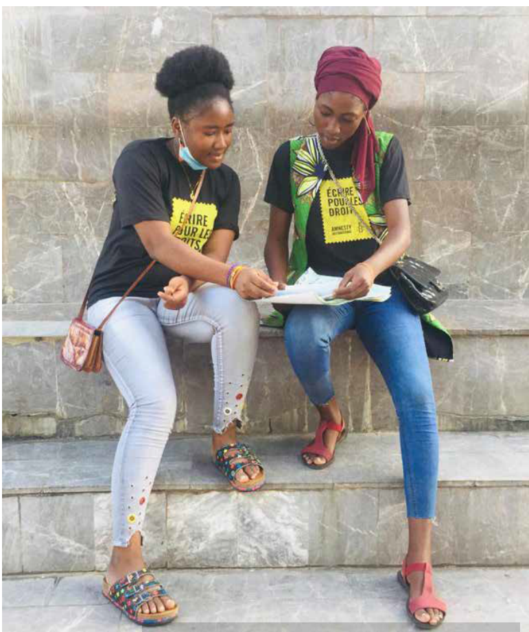
273808 Amnesty International Benin - W4R 2020

Адам құқықтары сән-салтанатқа қана арналған әшекей бұйымдары емес.