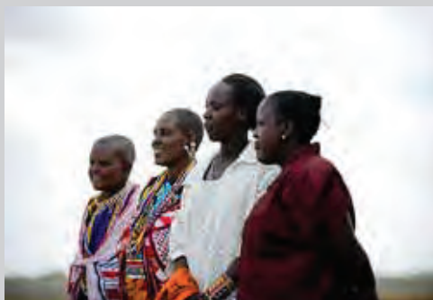
Des femmes kényanes à Narok.

L'incapacité d'un Etat partie à donner aux femmes l'accès aux soins de santé y compris des informations sur la contraception et la planification familiale et l'accès à l'avortement médicalisé au moins dans les cas d'agression sexuelle, de viol, d'inceste et lorsque la grossesse met en danger la santé mentale et physique de la mère ou la vie de la mère ou du fœtus, enfreint l'Article 14 ainsi que les Articles 2 (élimination de la discrimination), 3 (droit à la dignité), et 4 (droit à la vie, l'intégrité et la sécurité) du Protocole relatif aux droits des femmes. De tels manquements pourraient également enfreindre les Articles 3 (disposition portant sur l'égalité), 16 (droit à la santé), 17(1) (droit à l'éducation) et 18(3) (portant sur la non-discrimination) de la Charte africaine et Article 12 (accès aux soins de santé) de la CEDEF.