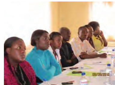
Formation de journalisme, Zambie, 2010

Bien que le Protocole relatif aux droits des femmes ne puisse pas toujours être le sujet de discussion principal des articles publiés dans la presse et des émissions médiatiques, les activistes peuvent trouver des méthodes novatrices pour lier les dispositions du Protocole relatif aux droits des femmes aux articles et émissions médiatiques existantes portant sur l'abus et la discrimination dont les femmes sont victimes. Les activistes peuvent, dans le cadre de leur stratégie médiatique, se servir de différentes tactiques pour mettre en exergue le Protocole relatif aux droits des femmes, notamment: