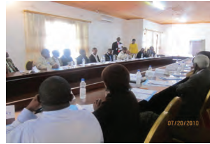
Formation de parajuristes en Zambie

Plusieurs parties prenantes, y compris les activistes, les ONG, les leaders communautaires, les décideurs, les hauts cadres du gouvernement, les avocats, les juges, les agents chargés de faire respecter la loi et le personnel médiatique, n'ont pas les connaissances nécessaires sur le Système africain des droits de l'Homme ou le Protocole relatif aux droits des femmes. 251 Les formations stratégiques de ces parties prenantes peuvent jouer un rôle critique dans la domestication du protocole relatif aux droits des femmes. De telles formations ne devraient pas seulement chercher à informer les participants, mais devraient examiner de manière stratégique les moyens dont chaque groupe peu s'impliquer dans la promotion des droits garantis par le Protocole relatif aux droits des femmes. A titre d'exemple, on pourrait entreprendre les activités suivantes: