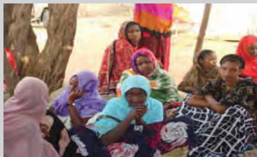
Des femmes Djiboutiennes discutent de l'élimination de la violence contre les femmes

L'incapacité d'un Etat partie à faire appliquer les lois et règlements interdisant toutes les formes de violence contre les femmes, y compris la violence domestique, le viol et la violence sexuelle enfreint les Articles 3, 4 et 8 (accès à la justice et à la protection égale devant la loi) du Protocole relatif aux droits des femmes. De tels manquements violent également les Articles 3 (dispositions portant sur l'égalité), 4 (respect pour la vie et l'intégrité de la personne), 5 (interdiction de toutes les formes d'exploitation et dégradation de la personne), 15 (droit à la santé), 18(3) (dispositions portant sur l'égalité) et 19 (dispositions relatives à la non-domination) de la Charte africaine.