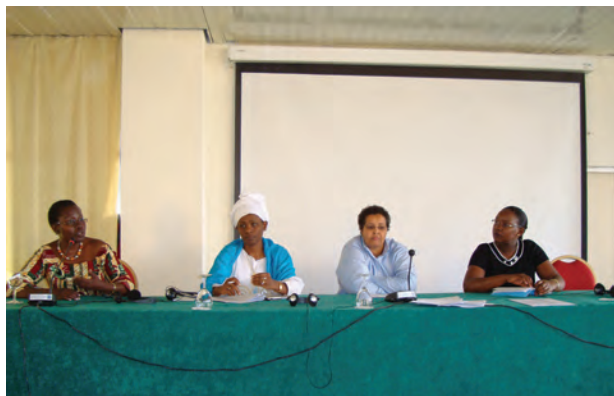
Egalité Maintenant et des représentantes d'UNIFEM, de l'UA et d'Oxfam GB à une réunion sur la domestication du Protocole, à Kigali au Rwanda, juillet 2009