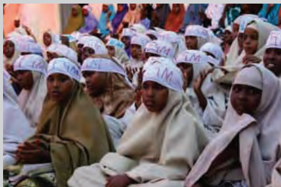
Des écolières à Galkayo, Somalie font campagne contres

Le Protocole relatif aux droits des femmes interdit clairement toutes les formes de mutilations génitales féminines. Voir Articles 2 (élimination de la discrimination), 3 (droit à la dignité), 4 (droit à la vie, l'intégrité et la sécurité) et 5 (élimination des pratiques néfastes). En particulier, l'Article 5 du Protocole relatif aux droits des femmes exhorte les Etats à prévoir des mesures exhaustives visant l'élimination de toutes les formes de Mutilations génitales féminines et d'accorder des services de soutien aux victimes.