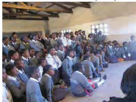
Espace sécuritaire de Kamulanga High School en Zambie

Les droits des filles âgées de moins de 18 ans sont prévus dans la Charte africaine des droits et du bien-être de l'enfant (« la Charte des enfants »), qui est entrée en vigueur en novembre 1999 (voir l'appendice I). En Mai 2011, 46 pays ont ratifié cette Charte (voir l'encadré 1.4). La Charte des enfants fait mention spécifique du droit de la fille à l'accès à l'éducation et pour une fille enceinte d'avoir la possibilité de compléter son éducation. Elle garantit aux filles le droit de ne pas subir des pratiques sociales néfastes parmi lesquelles les mutilations génitales féminines. La Charte des enfants aborde également l'exploitation sexuelle et la vente, le trafic et l'enlèvement des enfants, qui touchent principalement les petites filles. Le Comité africain d'experts en matière des droits et du bien-être de l'enfant a été constitué en 2001 en vertu des Articles 32 à 46 de la Charte relative aux enfants. Ce Comité, selon les dispositions de l'Article 44, examine les communications soumises concernant la violation des droits des enfants. 6