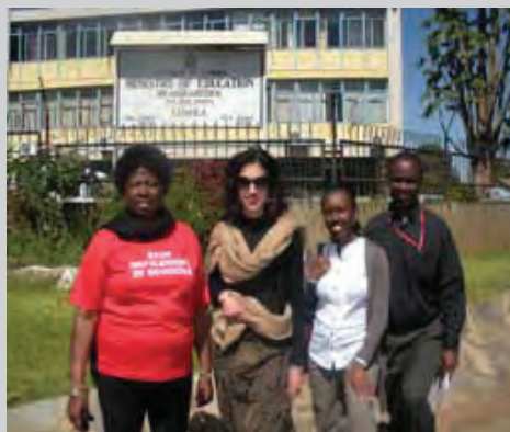
Egalité Maintenant rencontre des activistes locales pour mettre fin à la violence sexuelle dans les écoles en Zambie

Le 30 juin 2008, le juge de la Cour Suprême à Lusaka a rendu son jugement historique*, accordant une somme importante à R.M, en dommages et intérêts pour souffrances et douleurs ainsi que torture psychologique, dommages-intérêts exemplaires