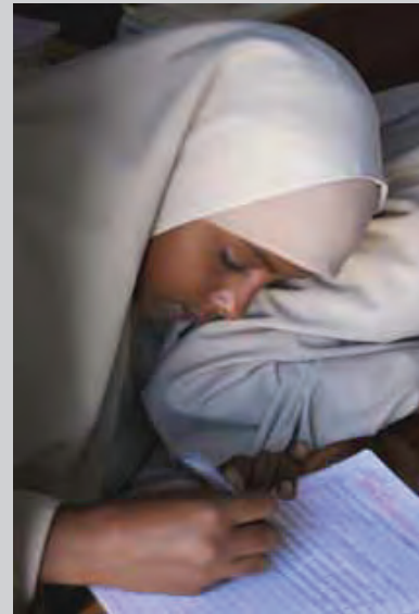
Une écolière en Somalie

L'incapacité d'un Etat partie à promulguer et à appliquer effectivement des lois et règlements permettant de garantir que les mariages sont conclus avec le plein et libre consentement des deux parties et également prévoir et appliquer le principe de l'âge minimum de mariage pour les femmes à 18 ans viole l'Article 6 du Protocole relatif aux droits des femmes. De surcroît, l'incapacité des Etats parties à protéger les femmes et les filles contre les mariages d'enfants ou forcés, y compris au moyen de la promulgation et l'application de lois relatives à la violence contre les femmes, en proposant des pénalités pour les auteurs et en accordant un soutien aux victimes enfreint les Articles 2(b), 3, 4 (a)-(c), (e) et (f), et 5 du Protocole relatif aux droits des femmes. De tels manquements enfreignent également l'Article 21(2) de la Charte africaine relative aux droits et au bien-être de l'enfant (précisant que l'âge minimum du mariage pour la fille est de 18 ans) et les Articles 3 (disposition sur l'égalité), 4 (respect pour la vie et l'intégrité de la personne), 16 (droit à la santé), 17(1) (droit à l'éducation) et 18(3) (disposition relative à la non-discrimination) de la Charte africaine relative aux droits de l'Homme et des peuples.