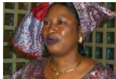
Rapporteuse Spéciale Soyata Maïga

La Commission africaine est dotée de mécanismes spéciaux tels que les rapporteurs spéciaux et les groupes de travail ayant pour rôle d'appuyer les activités en rapport avec la promotion des droits de l'Homme et des peuples. Le Rapporteur spécial sur les droits des femmes en Afrique constitue un tel mécanisme mis sur pied en 1999; le Rapporteur spécial est sélectionné parmi les Commissaires.