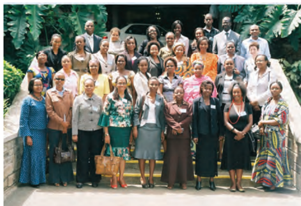
Membres de SOAWR à Nairobi, octobre 2009

Comme l'illustre l'encadré 1.4, ce ne sont pas tous les Etats membres de l'UA qui sont parties au protocole. Dans les Etats qui n'ont pas encore ratifié le Protocole relatif aux droits des femmes, des stratégies de plaidoyer mettront sans doute l'accent sur la ratification. Les ONG, dans plusieurs pays, ont réussi à constituer des réseaux et alliances pour assurer la coordination des campagnes pour la ratification. A cet égard, elles se sont servies des personnalités qui ont joué un rôle d'avant-garde dans la lutte pour les droits des femmes ainsi que d'autres acteurs éminents au niveau national pour servir de militants de premier rang. La promotion de la ratification a été faite par le biais des campagnes de sensibilisation et des entretiens tenus avec les cadres du gouvernement non seulement à l'occasion des sessions de la Commission africaine, des Sommets de l'UA et des missions à l'UA, à Addis Abéba, Ethiopie, mais aussi au niveau national. 249