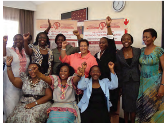
Membres de la coalition SOAWR célèbrent la ratification du protocole par l'Ouganda

Avant l'adoption du Protocole relatif aux droits des femmes, un document de consensus parmi les ONG visant le renforcement du projet de protocole a été convenu lors d'une réunion convoquée en janvier 2003 à Addis Abéba par le Bureau régional d'Égalité Maintenant pour l'Afrique aux fins de soutenir le projet de Protocole. La réunion a connu la participation de groupes des droits des femmes dont le Centre africain pour la démocratie et études en droits humains, Akina Mama wa Afrika, Égalité Maintenant, Ethiopian Women Lawyers Association (Association des femmes juristes d'Éthiopie), Femmes Africa Solidarité, Réseau des femmes africaines pour le développement et la communication (FEMNET), Association des femmes juristes du Mali, Association des femmes juristes du Sénégal, Women In Law And Development In Africa (WiLDAF), et Women's Rights Advancement And Protection Alternative (WRAPA). Ce document de consensus était fondé sur des instruments internationaux existants tels que la Convention sur l'élimination de toutes les formes de discrimination contre les femmes ("la CEDEF"), mais était adapté spécifiquement au contexte africain. Le groupe d'ONG a par la suite plaidé, auprès des gouvernements, en faveur d'un solide Protocole relatif aux droits des femmes.